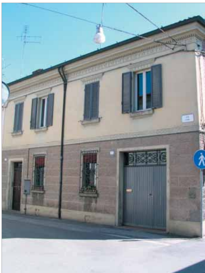
Via Fiume 35; 37 Fronte Principale